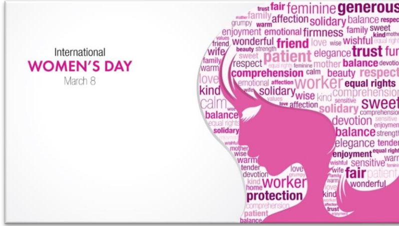
صورة مرفقة مع المنشور