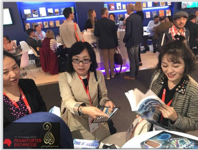
صورة مرفقة مع المنشور

إجابة السيد أحمد الحسن (ع) على أحد المستشكلين على منشور صور معرض الكتاب الدولي - ألمانيا