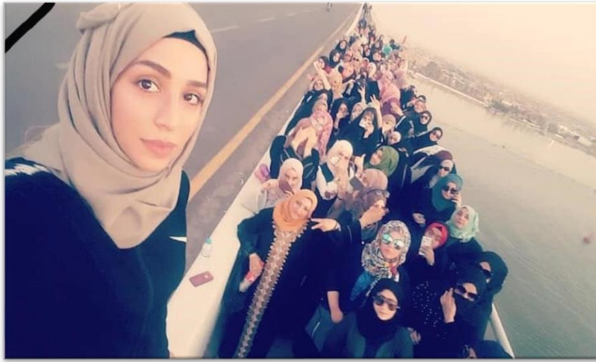
صورة مرفقة مع المنشور