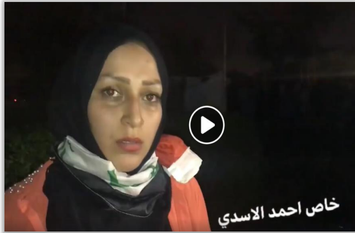
متظاهرة من البصرة

وحول دور المرأة في صناعة التاريخ نشر السيد أحمد الحسن (ع) فيديو لناشطة مدنية (2)