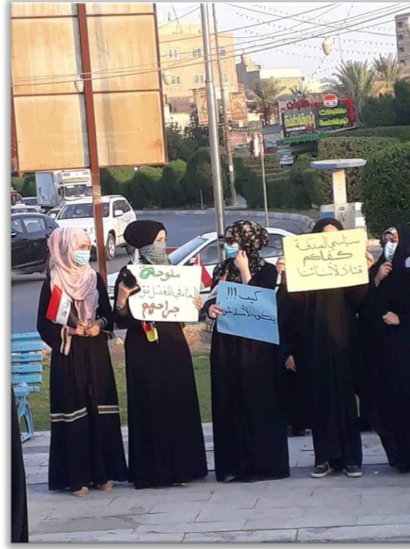
صورة مرفقة مع المنشور